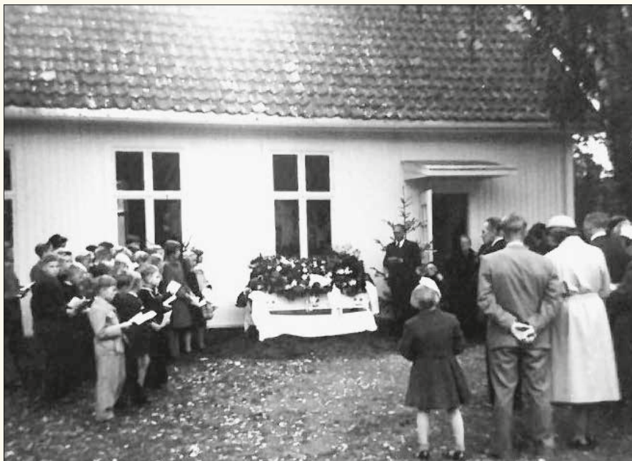
Begravelse fra Hørte bedehus i 1955.

Fra ca. 1918 og utover var det stor vekkelse på Hørte. Private stuer ble for små. Også en sal i 2. etasje på butikken ble for liten. Så blei garverisalen brukt. Men denne veknelsen fødte ideen om et bedehus.