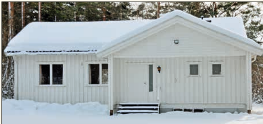
Sunds bedehus i 2018.