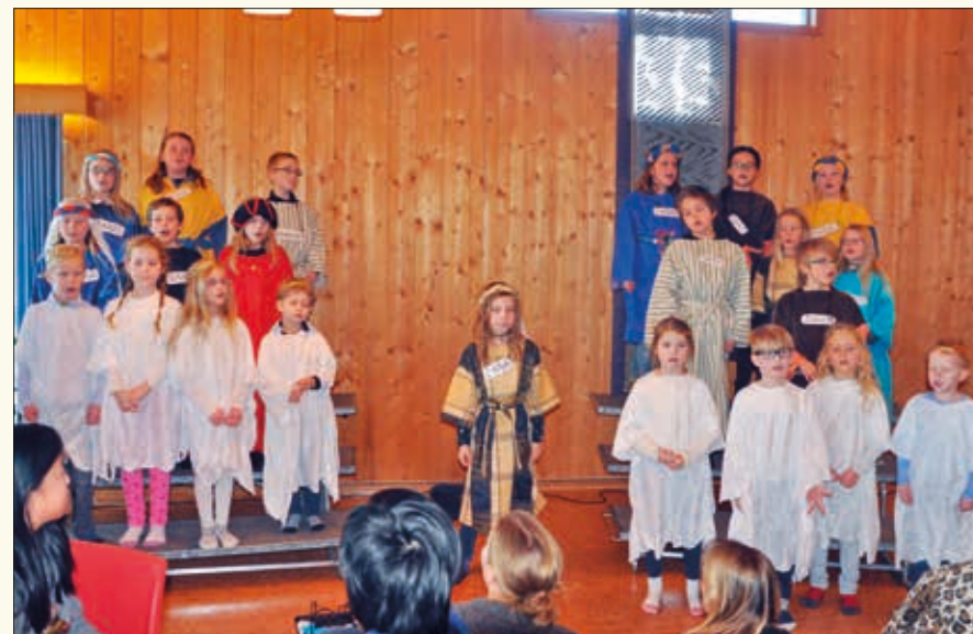
Barna hadde lært mye tekst, og mye bibelhistorie, gjennom sitt musikkspill.

vært misjonær i Bangkok i Thailand. Nå er hun i en stilling delvis for Misjonsselskapet her hjemme og delvis i Bangkok. Hun fortalte at i Bangkok er hun omgitt av 17 millioner mennesker, mens i Hvittingfoss, der hun bor, er det 1000 innbyggere. Kontrastene i Thailand er enorme, 0,2 prosent av innbyggerne eier 80 % av landet. Mange i landet lever i fat-