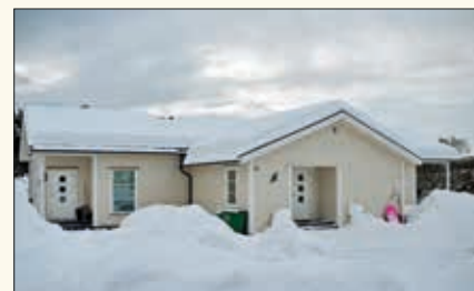
Det som var Hørte bedehus ser slik ut i 2018.

barnehage på Hørte bedehus. Hørte Indremisjon overtok drifta i 1983 og dreiv barnehagen fram til sommeren 1998. Da var det for få unger på Hørte til å fortsette. Da Indremisjonen overtok drifta bygde de på et lagerrom.