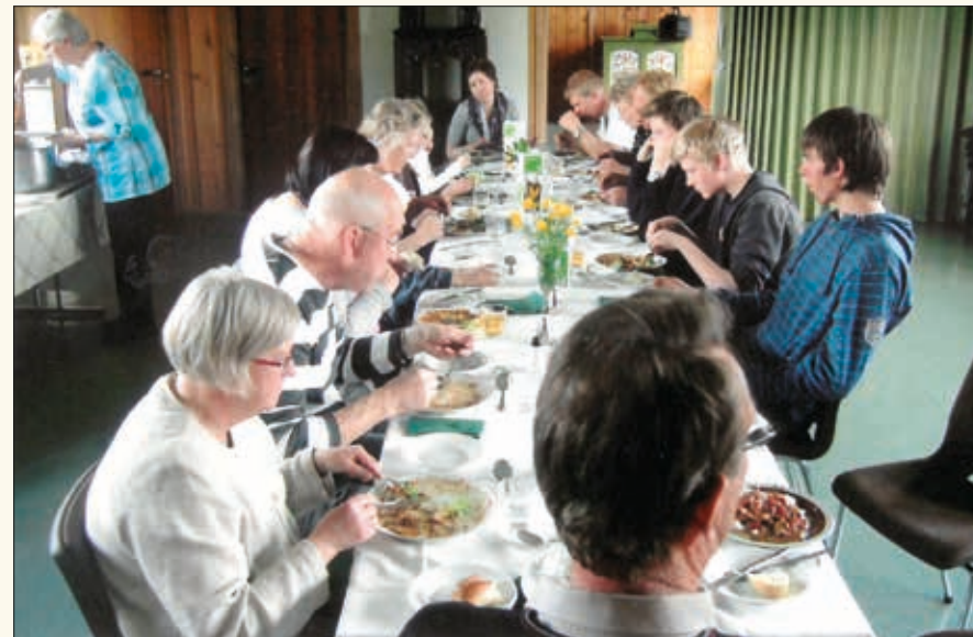
Avskjedsmiddag på Hørte bedehus i 2010.

Etter 50 års bruk var det behov for å gjøre noe. Ny oppussing blei diskutert, men man gikk for nybygg siden foreningen hadde fått ei gave på kr. 40.000. Det nye bedehuset blei innvia 27. mai 1973. Det var 150 kvadratmeter og hadde storsal, liten sal, kjøkken og toalett. Sentraler