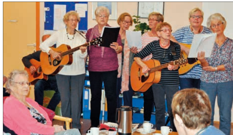
Sauherad diakoniforening arrangerer ettermiddagskaffe på Bygdeheimen, Furuheim og Furumoen. Her har de tatt med seg Sunds-musikken til Furuheim.