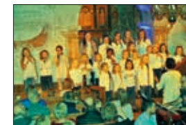
Midt-Telemark Soul Children fylte Nes kyrkje til sin julekonsert onsdag 13. desember.