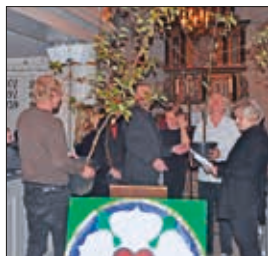
Etter reformasjonsjubileums-konserten i Sauherad kyrkje 1. november fikk solistene hvert sitt epletre.