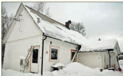
Moen bedehus i 2018.