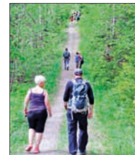
Pilgrimsvandringa mellom Nes kyrkje og Bø gamle kyrkje ble gjennomført 25. mai – Kristi himmelfartsdag.